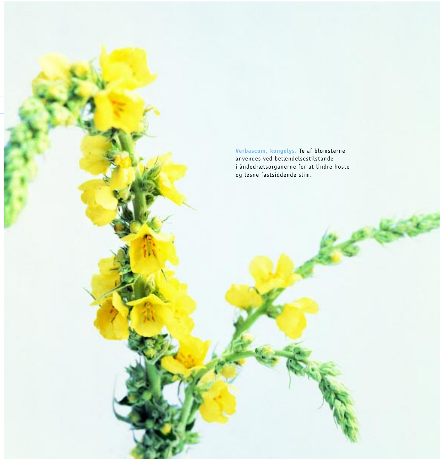
Verbascum, kongelys. Te af blomsterne anvendes ved betændelsestilstande i åndedrætsorganerne for at lindre hoste og løsne fastsiddende slim.

Sygdommen giver mennesket mulighed for at erkende og forstå den tilstand af ubalance det er kommet i med legeme og sjæl, og for at bringe den i balance igen ved hjælp af terapien. Gennem kronisk sygdom kan man finde nye adfærdsmuligheder og modnes som personlighed. Antroposofiske læger understøtter patienten i denne opgave. De styrker hans egenansvarlighed, anerkender hans myndighed, støtter hans ret til medbestemmelse ved valg af terapimetode og hans bestræbelser på at bevare sin sundhed.