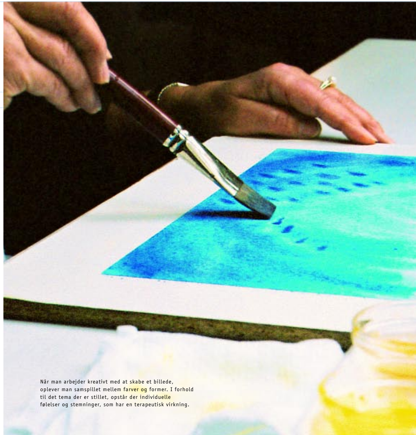
Når man arbejder kreativt med at skabe et billede, oplever man samspelet mellem farver og former. I forhold til det tema der er stillet, opstår der individuelle følelser og stemninger, som har en terapeutisk virkning.

I 1921 indrettedes de første, dengang endnu beskedne, klinikker i Arlesheim ved Basel (Schweiz) og i Stuttgart (Tyskland), hvor denne nye medicinske metode fandt praktisk anvendelse. Med dette som udgangspunkt har den antroposofiske medicin siden bredt sig til det meste af verden og samtidig videreudviklet og forvandlet sig.