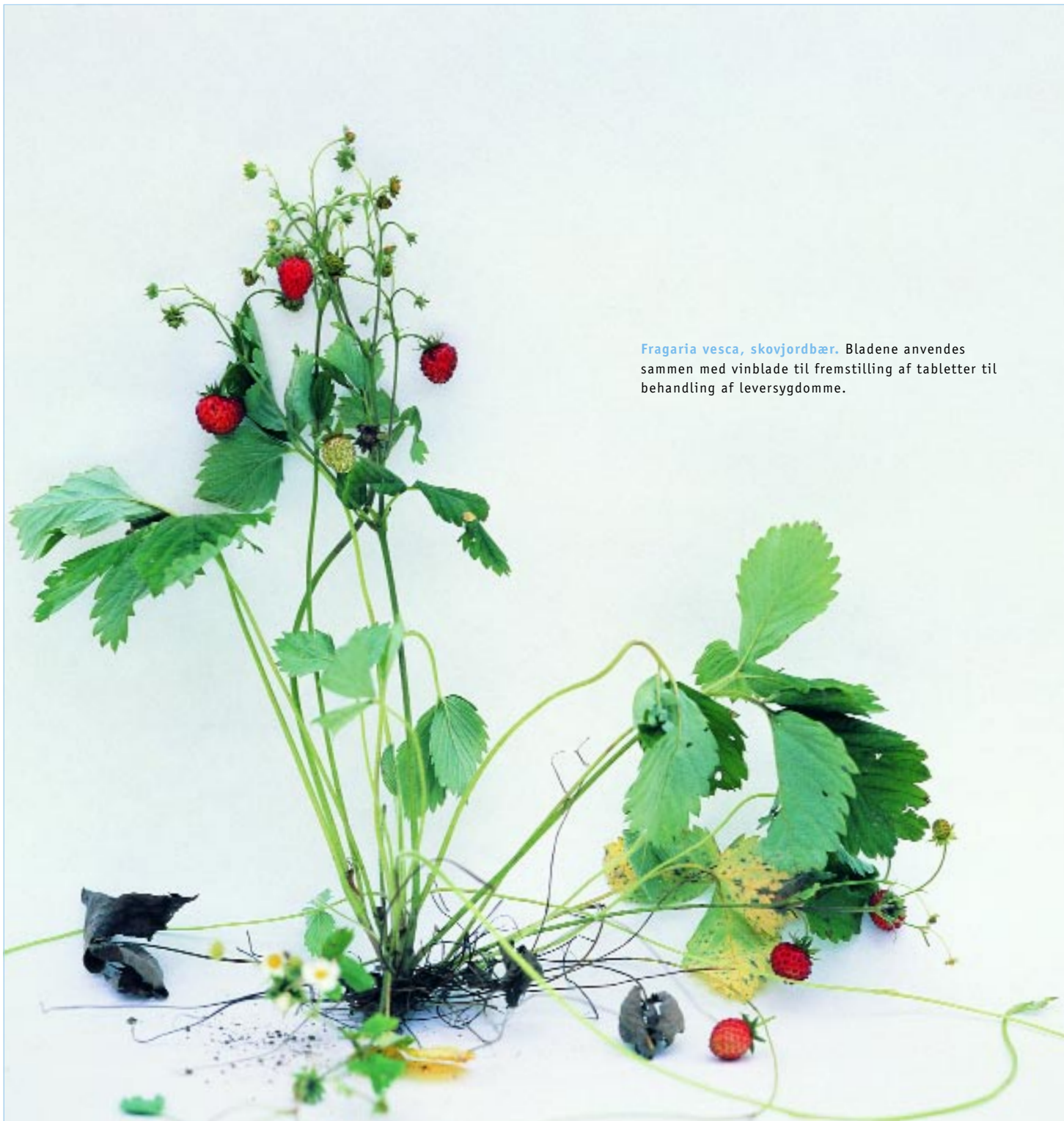
Fragaria vesca, skovjordsbær. Bladene anvendes sammen med vinblade til fremstilling af tabletter til behandling af leversygdomme.