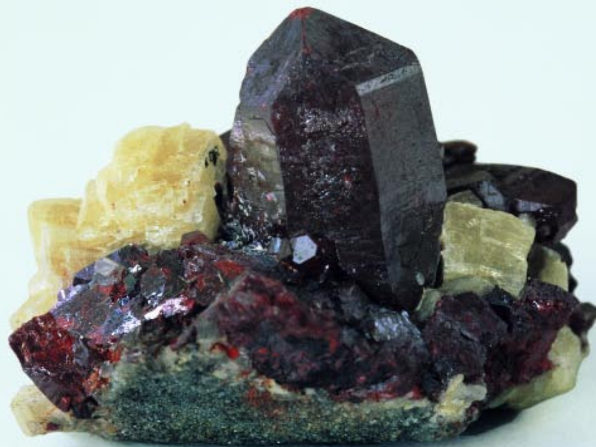
Cinnober. Minerallet bliver pulveriseret og anvendt til fremstilling af tabletter til behandling af akut og kronisk katar i luftvejene.

I svære akutte eller livstruende sygdomstilfælde kan det naturligvis være nødvendigt at anvende allopatiske lægemidler. Men hvis det kan undgås, bliver sygdomssymptomerne ikke slået ned. I stedet forsøger man at aktivere patientens egne regenerationskræfter ved hjælp af homøopatisk fremstillede og andre antroposofiske lægemidler og således stimulere kroppen til at udligne den ubalance der ligger til grund for sygdommen.