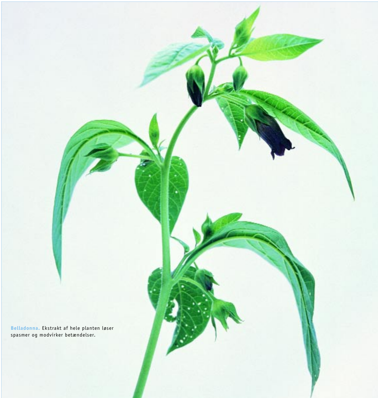
Belladonna. Ekstrakt af hele planten løser spasmer og modvirker betændelser.